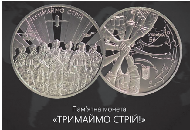
Пам'ятна монета «ТРИМАЙМО СТРИЙ!»

На реверсі продовжено тематику аверсу — зображені воїни, які впевнено йдуть у наступ. У верхній частині монети півколом розміщено напис ТРИМАЙМО СТРИЙ,