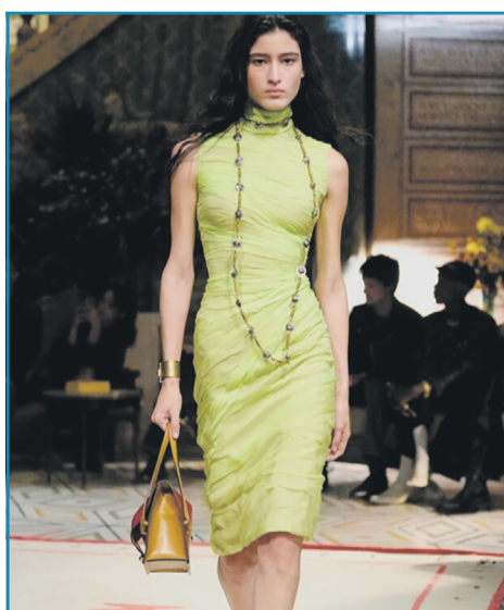
▶ ДРАПІРОВАНА СУКНЯ

Ще одним модним трендом стає квітковий принт. Зверніть увагу на сукні з об'ємними, великими квітами, які особливо красиві на одязі довжини міді та максі. Також в тренді вбрання з яскравими маленькими квітками, що можуть бути різнокольоровими або виконаними в одному тоні. Вони роблять образ оригінальним та жіночним.