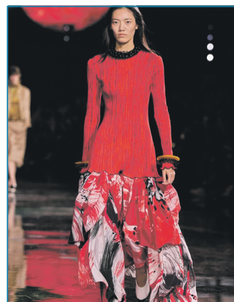
▶ СУКНЯ ДОВЖИНИ МАКСІ

Один з найнеочікуваніших трендів весни 2026 року — сукні з округлою, об'ємною спідницею. Вони авангардні та незвичайні на вигляд, при цьому роблять образ досить стильним. Такі моделі мають стриманий верх, можуть бути довжини міні чи міді. Дизайнери пропонують моделі в яскравих та ніжних відтінках, що дозволяють кожній жінці вибрати кращий варіант.