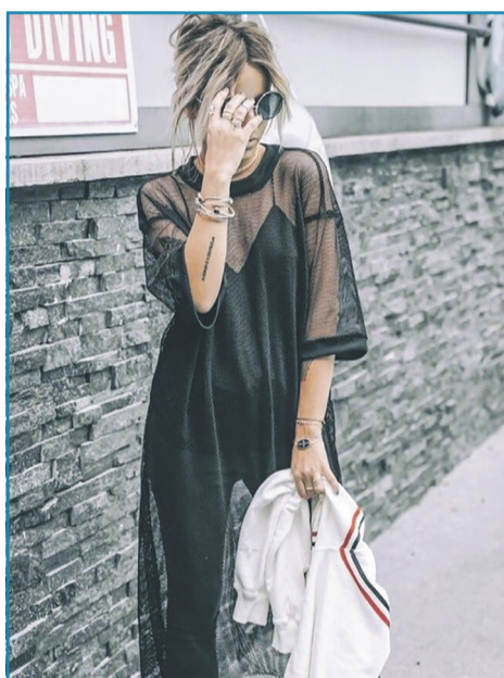
▶ НАПІВПРОЗОРА СУКНЯ

Залишається в моді, та навесні 2026 вона стає ніжнішою. Пастельні відтінки — від м'ятого до лавандового — додають образу свіжості й легкості. Такі сукні максимально лаконічні, при цьому підкреслюють красиву фігуру. Можете носити їх з кардиганами чи піджаками.