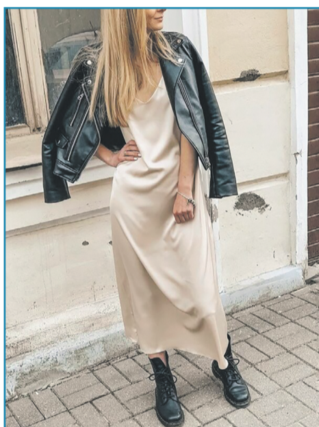
▶ СУКНЯ-КОМБІНАЦІЯ В ПАСТЕЛЬНИХ ВІДТІНКАХ

Весною 2026 року ви можете обирати короткі сукні з силуетом, який виділить вашу фігуру. Зокрема, дизайнери пропонують моделі з об'ємним низом, чіткими плечами, акцентованою талією, що дозволяє створити майже архітектурну форму. Таке вбрання є сміливим, але водночас дуже стильним, особливо у поєднанні з мінімалістичними аксесуарами.