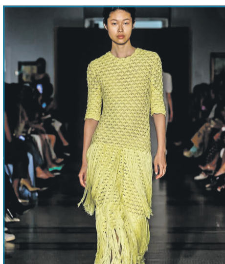
▶ СУКНЯ З БАХРОМОЮ

В трендах залишаються напівпрозорі сукні, які тепер можна носити навіть в повсякденному образі. Зокрема, можна створювати багаточарові луки або ж доповнити сукню подовженим жакетом. Обирайте вбрання в темних або яскравих відтінках.