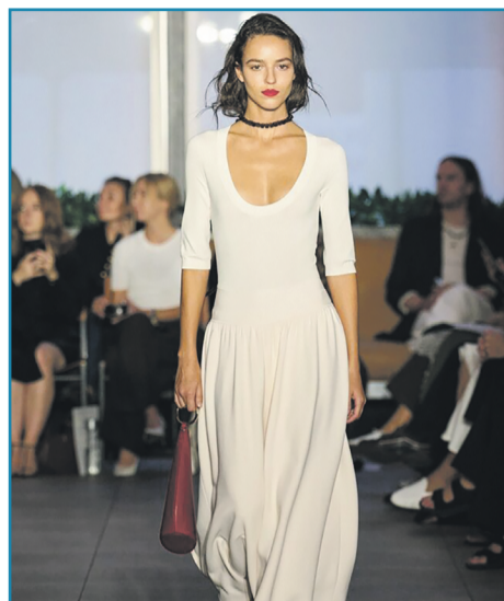
▶ СУКНЯ З ЗАНИЖЕНОЮ ТАЛІЄЮ

проявляти свій характер та індивідуальність. В трендах одночасно є ніжні романтичні силуети й чіткі структурні форми, що дозволяють кожній жінці обрати саме те, що акцентує на її образі. Розглянемо наймодніші сукні весни 2026 року.