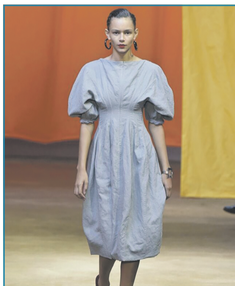
▶ СУКНЯ З ОБ'ЄМНОЮ СПІДНИЦЕЮ

Якщо хочете створити ніжний та дуже жіночний образ, сукня з драпіруванням стане гарним варіантом. В моді моделі довжини міді, які вирізняють фігуру та облягають стан. Обирайте сукні в ніжних відтінках або з мінімалістичними принтами. Крім того, можете звернути увагу на приталені моделі, які підкреслюють фігуру.