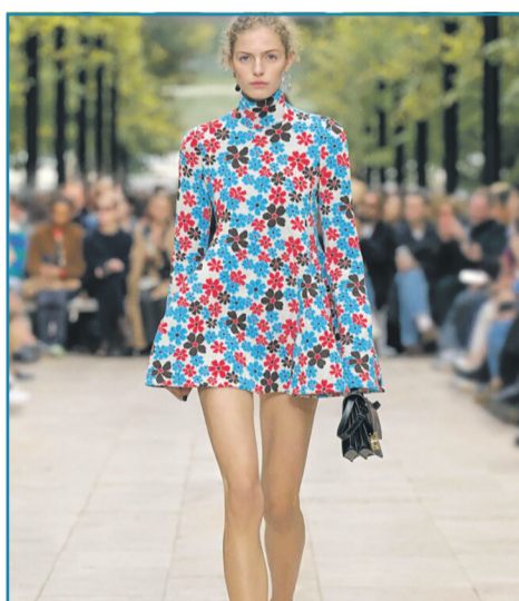
▶ СУКНЯ З КВІТКОВИМ ПРИНТОМ

В новому сезоні дизайнери пропонують обирати сукню-сорочку з чітким кроєм та привабливими акцентами. Зокрема, в тренді будуть варіанти з асиметричними застілками, великими кишенями, акцентними поясами, об'ємними рукавами. Такі моделі прекрасно доповнюють офісний стиль.