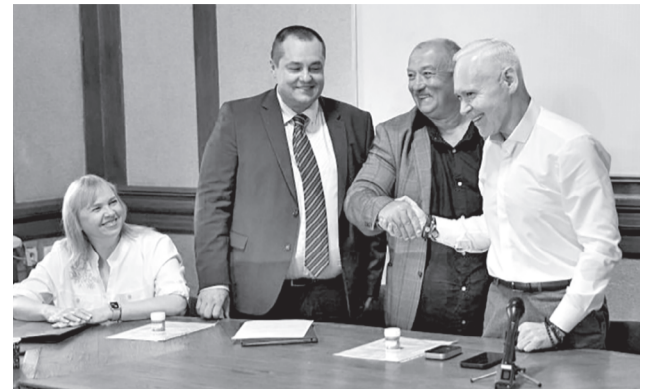
Ігор Терехов та інші представники інституту на зустрічі.

— Вдячний за те, що ви працюєте, що ви є у Харкові, — наголосив Ігор Терехов. — Сьогодні для нас дійсно дуже важливо, щоб виші, науковці, науково-дослідницькі інститути залишалися у Харкові. Бо Харків завжди відрізнявся від інших міст великим інтелектом. Наше спільне завдання — його зберегти.